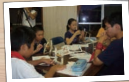
※写真は過去の開催の様子です。