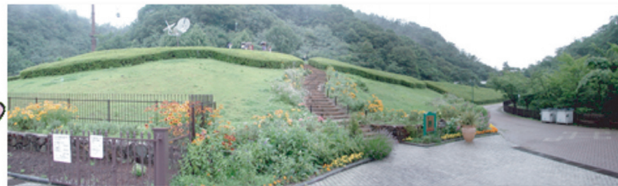
②ハーブ園内「風の丘」