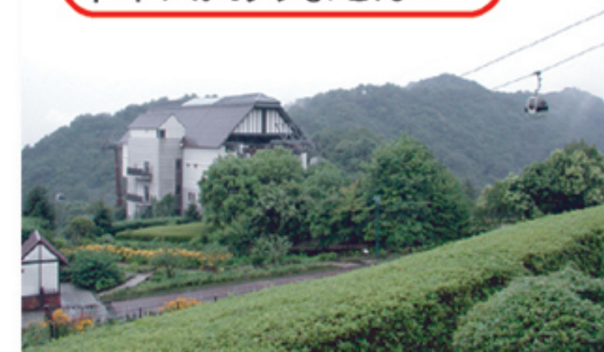
①新神戸ロープウェイ 「風の丘」駅