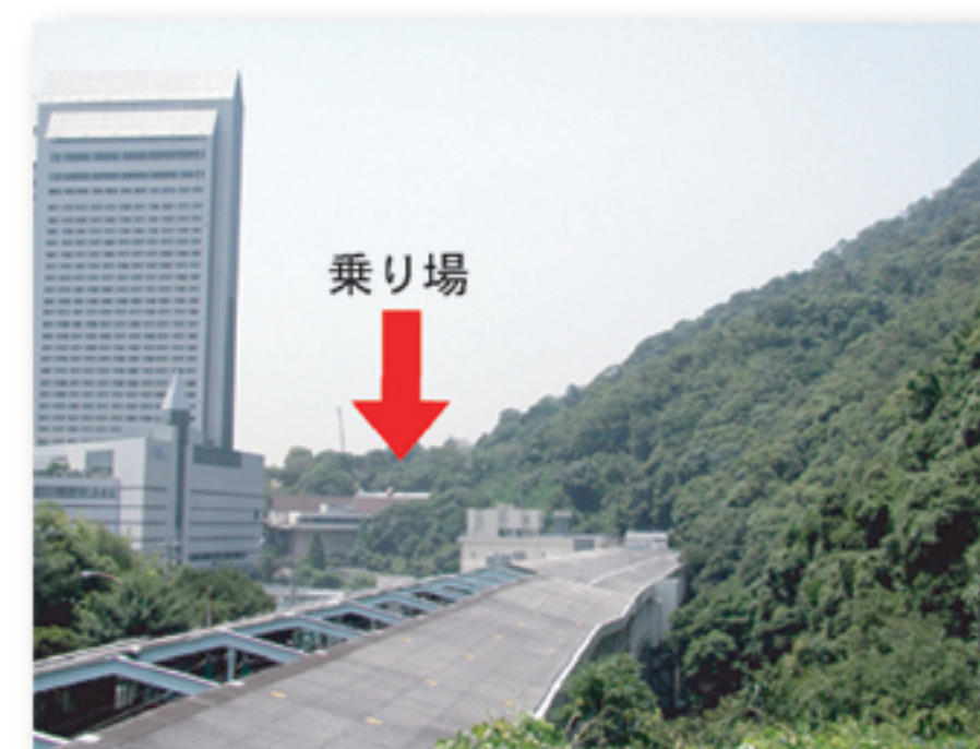
⑨新神戸駅から ロープウェイ乗り場を見る