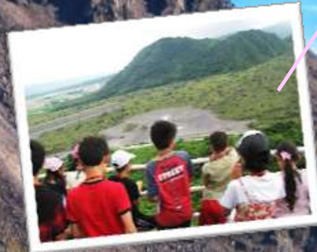
野外で景色の観察