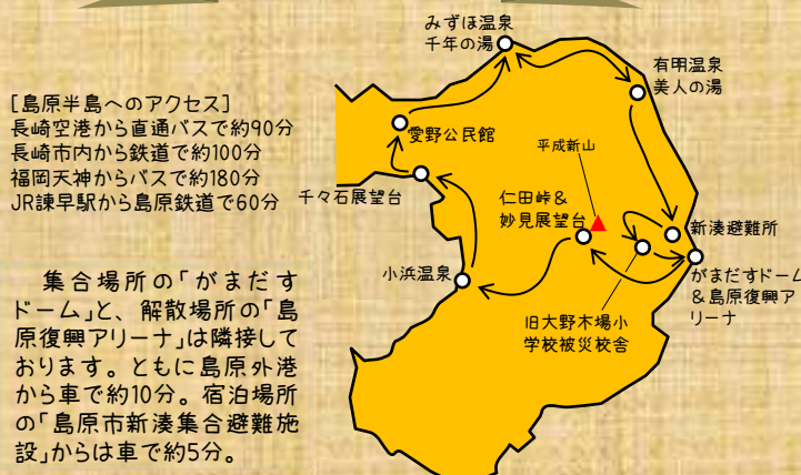
サマースクール謎解きマップ